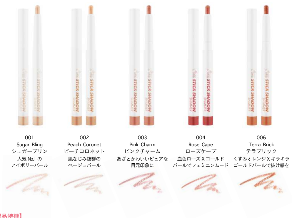
001 Sugar Bling シュガーブリン 人気No.1の アイポリーパール